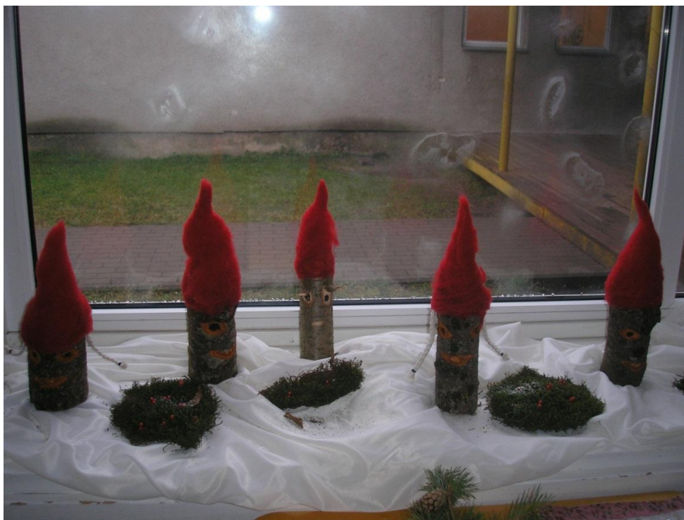
Sipsikute rühma jõulud