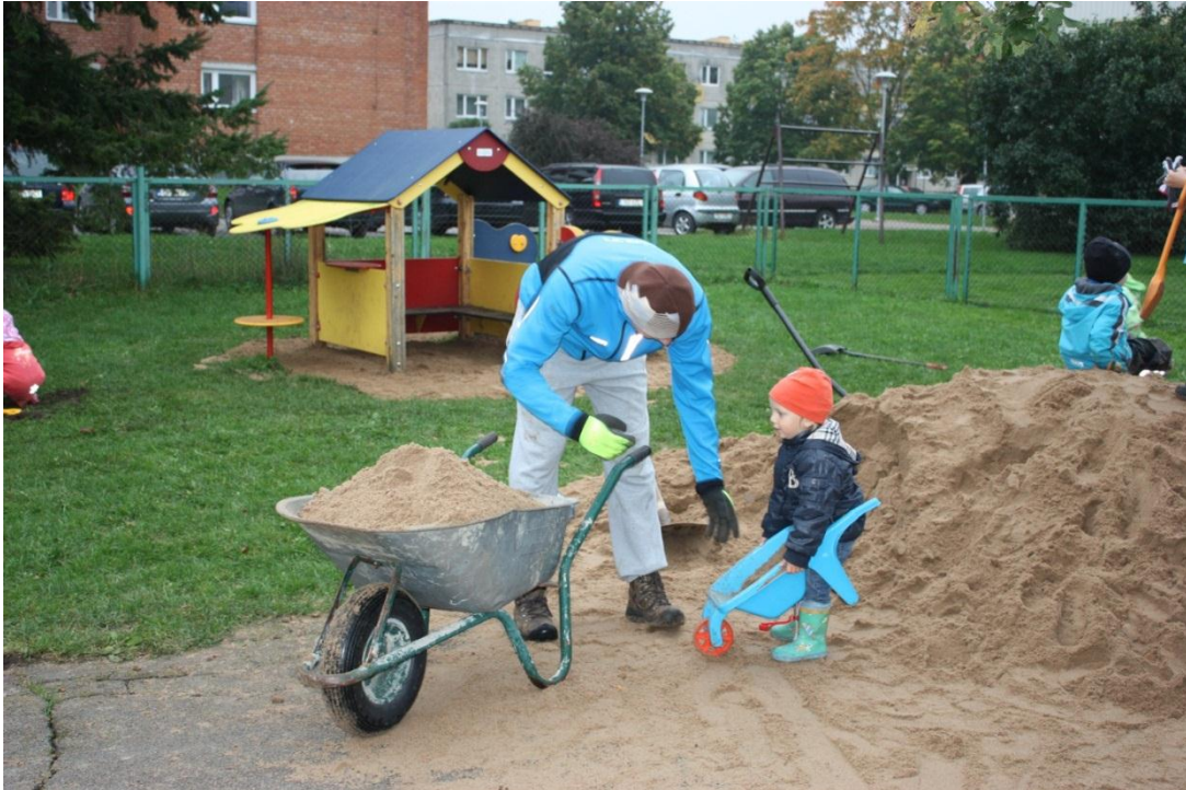
Suur ja väike töömees