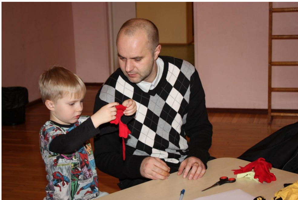
Issi õmbleb mulle jänese!

meisterdamine), „Teeme teatrit“ (näpu- ja käpiknukud), „Seemneprojekt“ (seemnete kasutamine meisterdamiseks), „Mänguasi“ (mänguasjade meisterdamine).