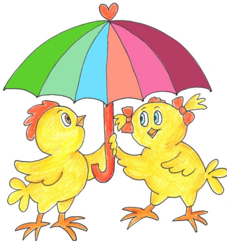
Tibutare väärtused (logo autor: Ave Peebo)

KESKKOND – suur ja roheline õueala, ümbritsev loodus oma võimalustega