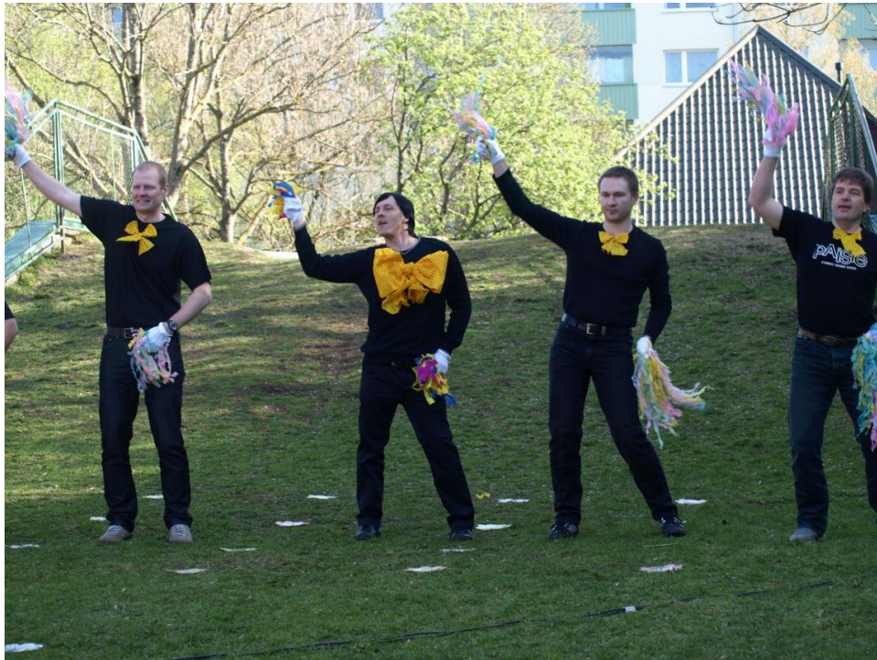
Vaprad isad tantsivad emade rõõmuks