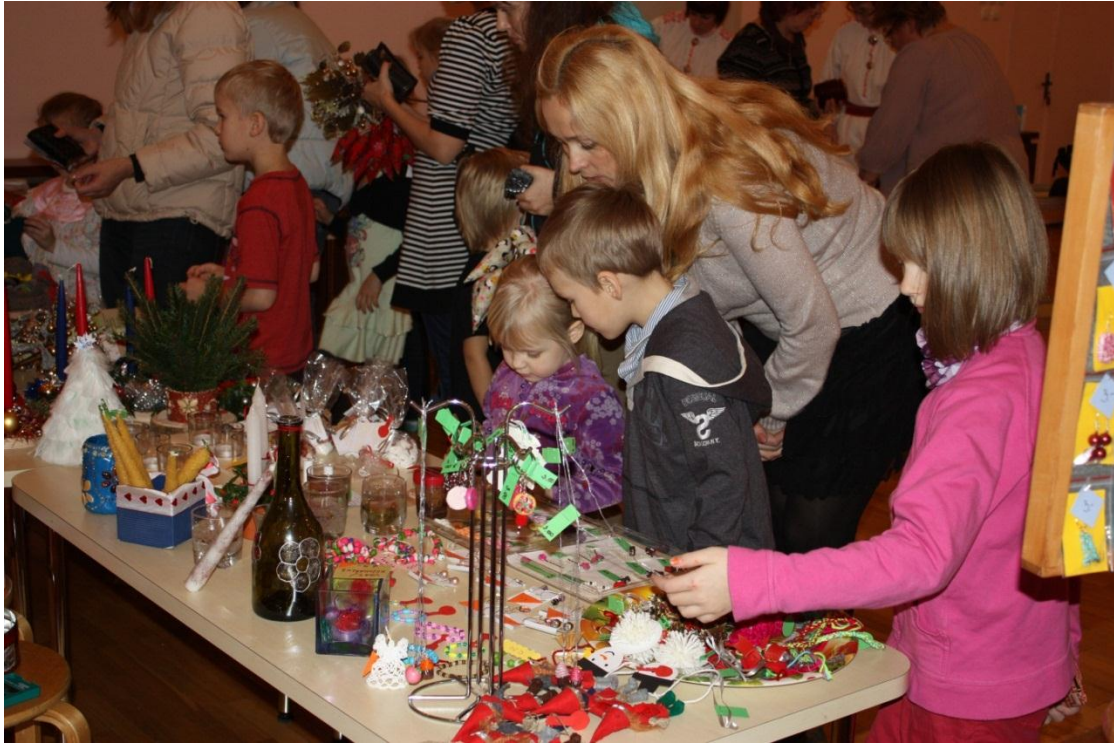
Nii palju põnevat kaupa...