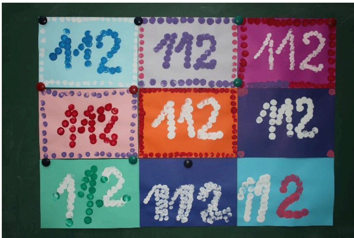
Tibutare Piilude näpud trükkisid 112, mis käe sees see meeles