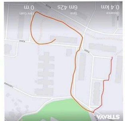
Mikid (6-7 aastased)