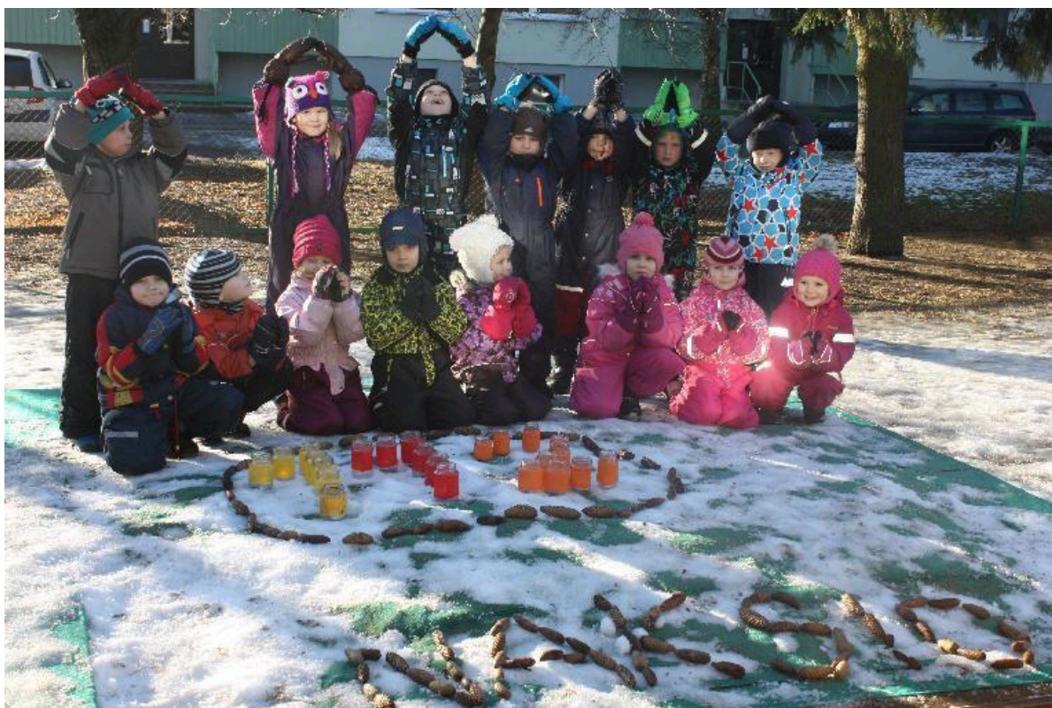
Tibutare Nakside kolme värvi valgust kiirgav 112 tõuseb kõrgele-kõrgele...