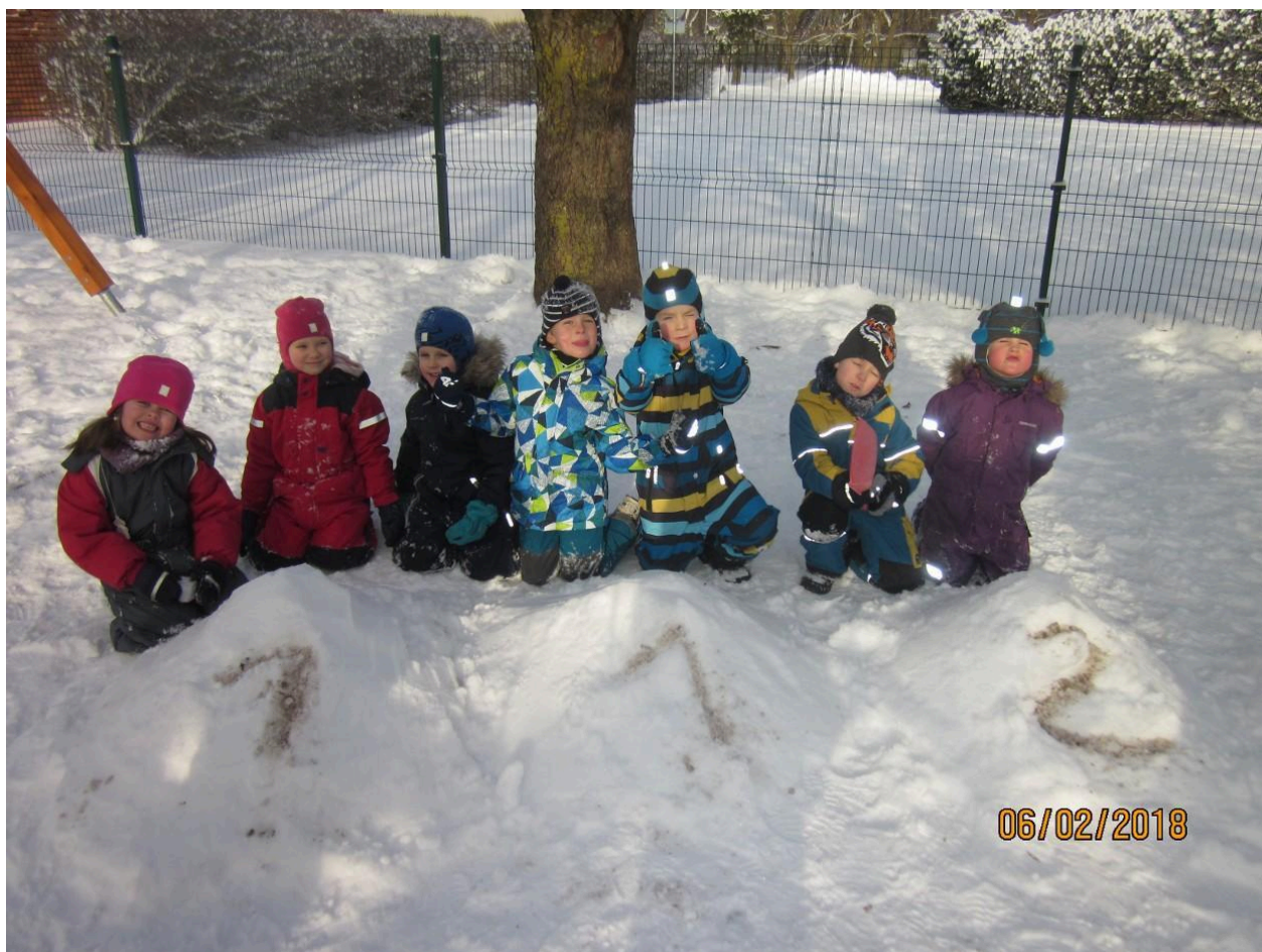
Piilud ja 112