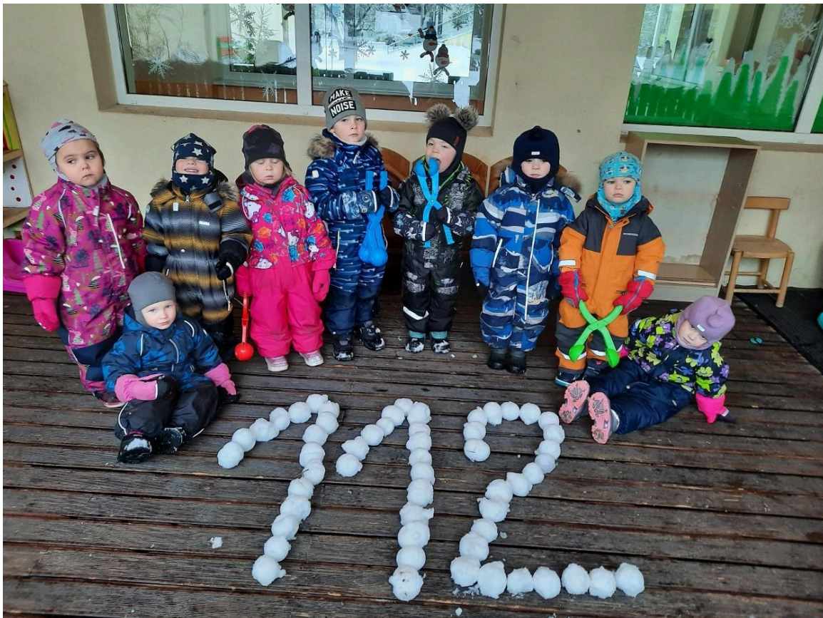
Sipsikud (3-4 aastased)