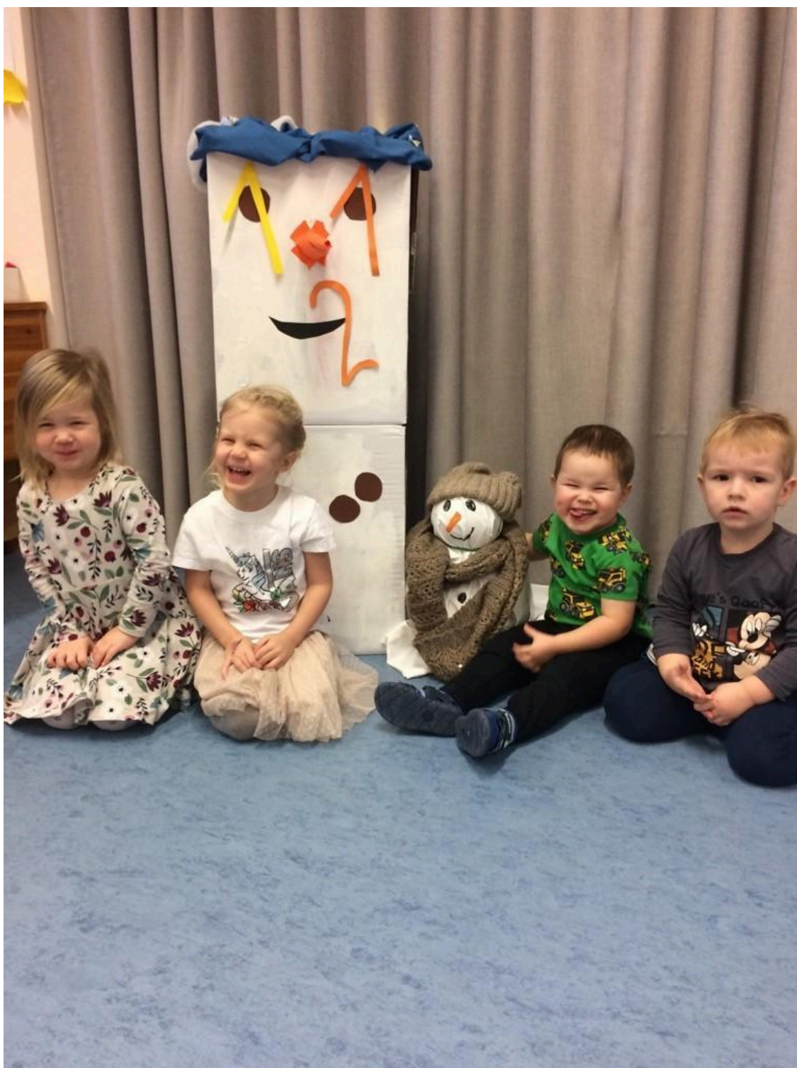
Muumid (2-3 aastased)