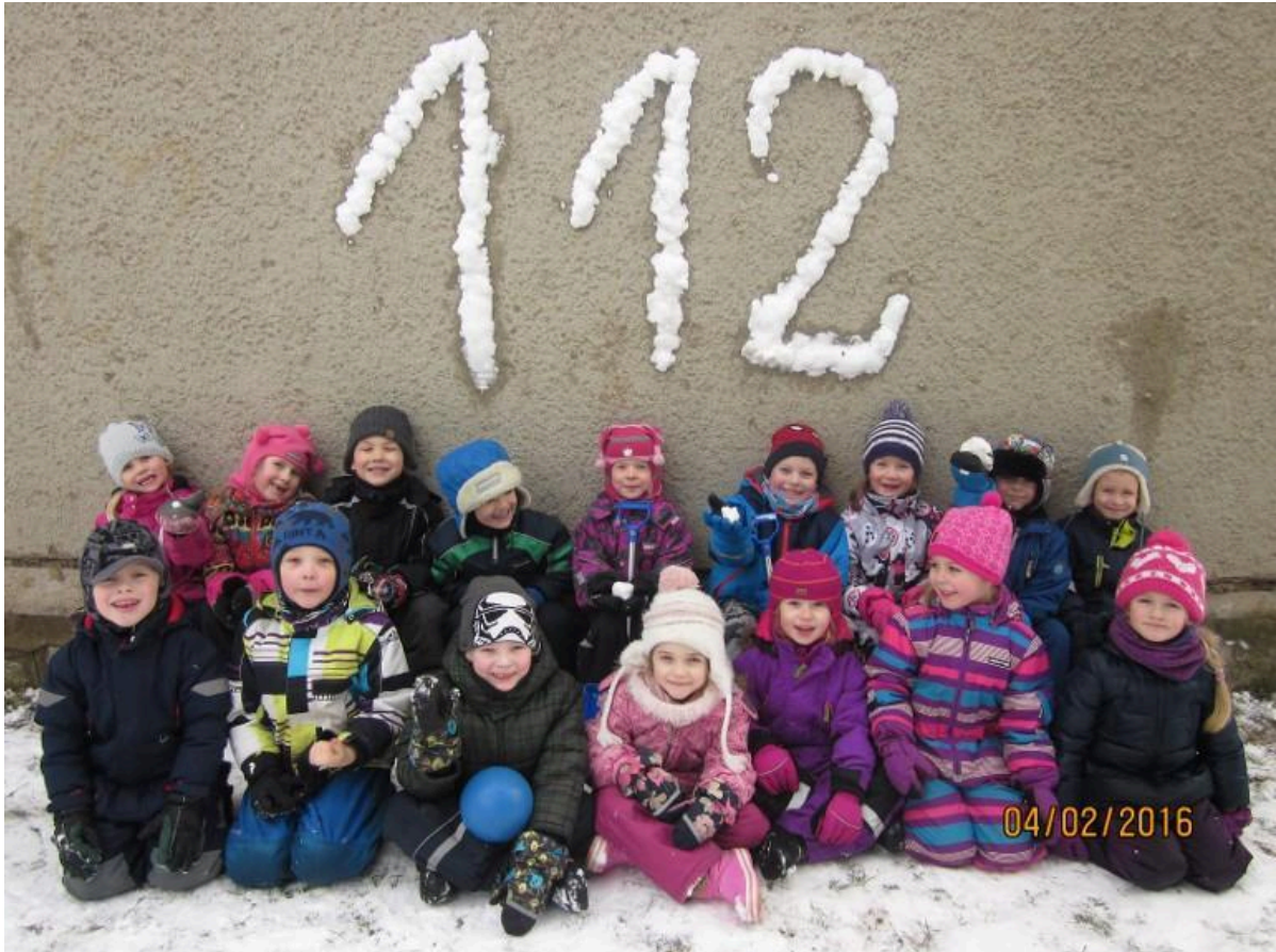
Nakside rühma lapsed teavad nüüd, et 3 on meeskond: kiirabiarst, politsei ja päästja.