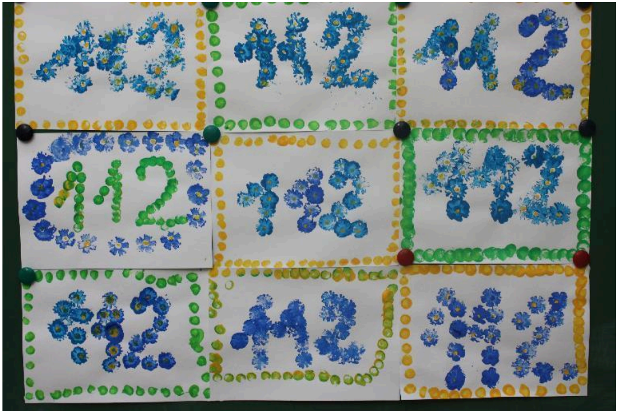
Tibutare Kiisude 112 Eesti rahvuslille templina