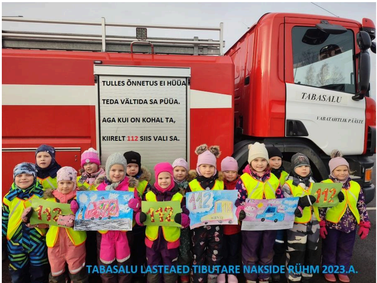
Naksid (5-6 aastased)