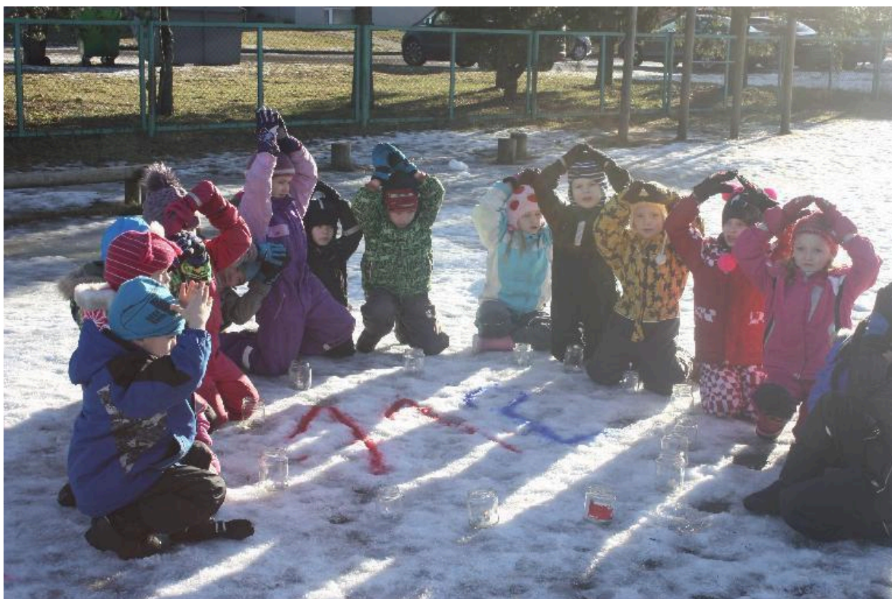
Tibutare Tibude 112 väreles leegina nii küünleegis kui ka kehakeeles