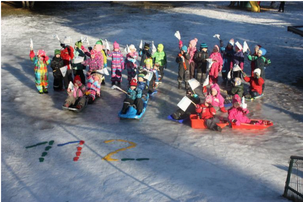
Tibutare Kröllid ja Naksid jätsid jalajäljed ja moodustasid üheskoos mänguhoos 112