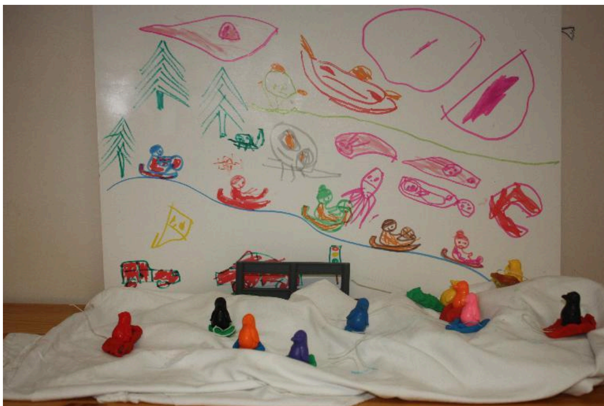
Tibutare väikesed Muumid õppisid ohte tundma rühmas