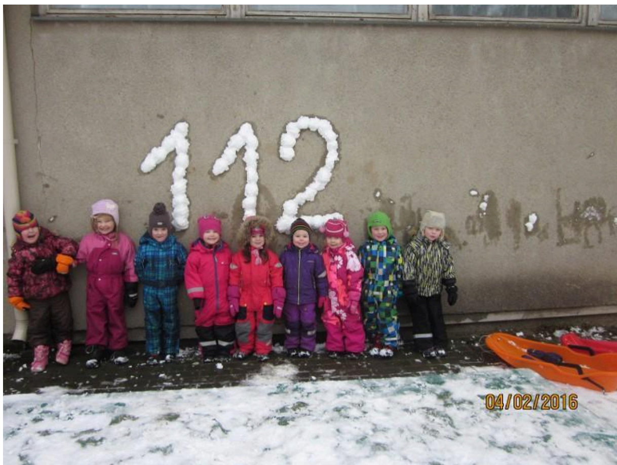
Piilud kogusid lume numbriks 112