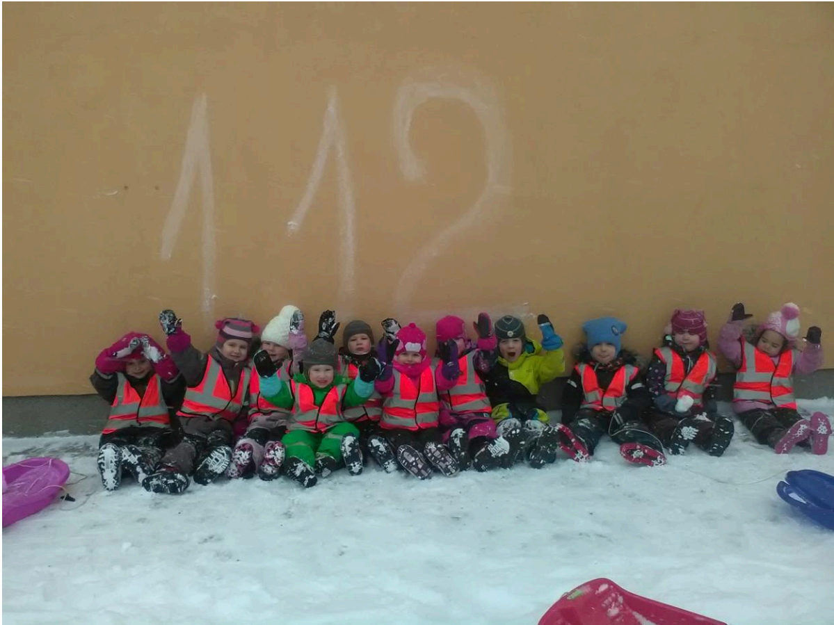
Muumid ja 112