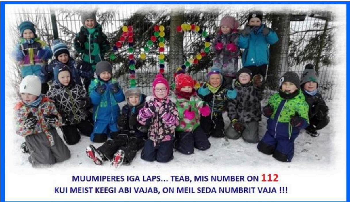
Naksid ja 112