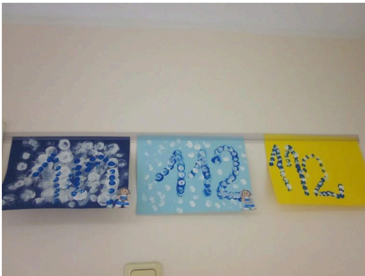
Muumide 112 meenub seest välja ja väljast sisse vaadates.