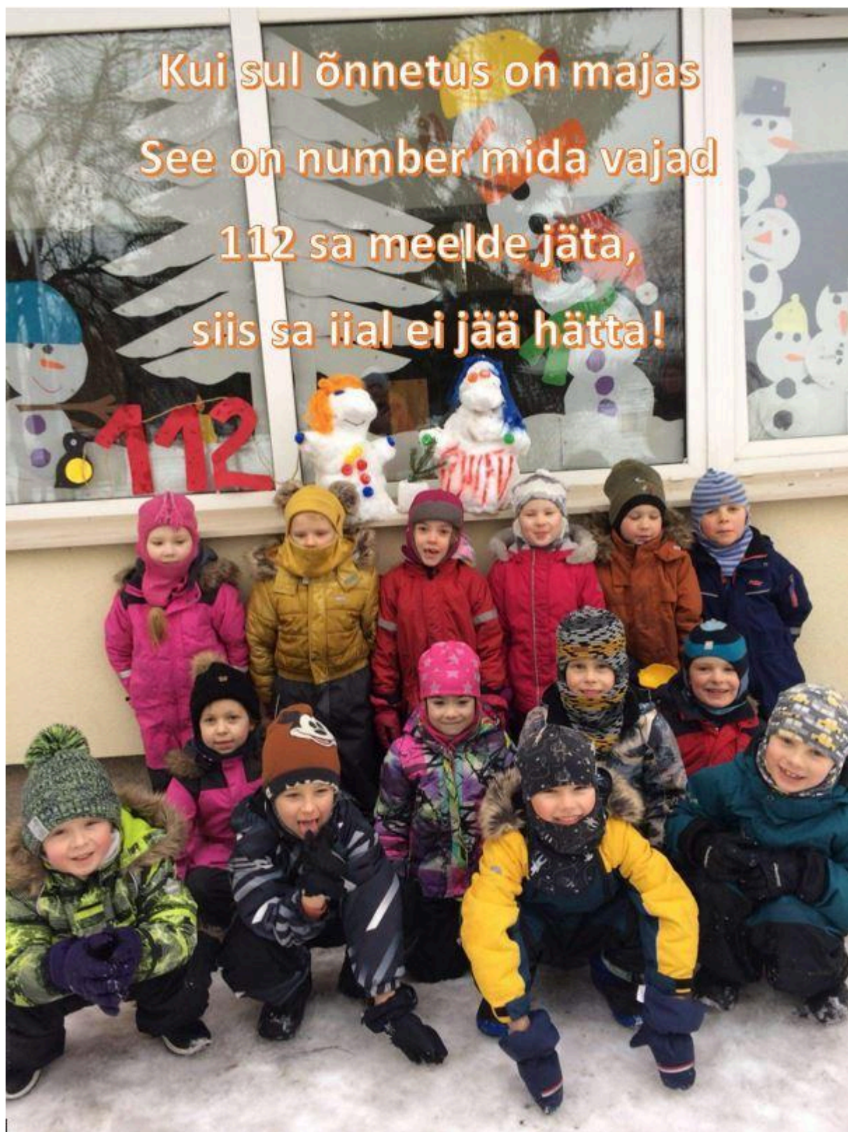
Muumid 6-7 aastased