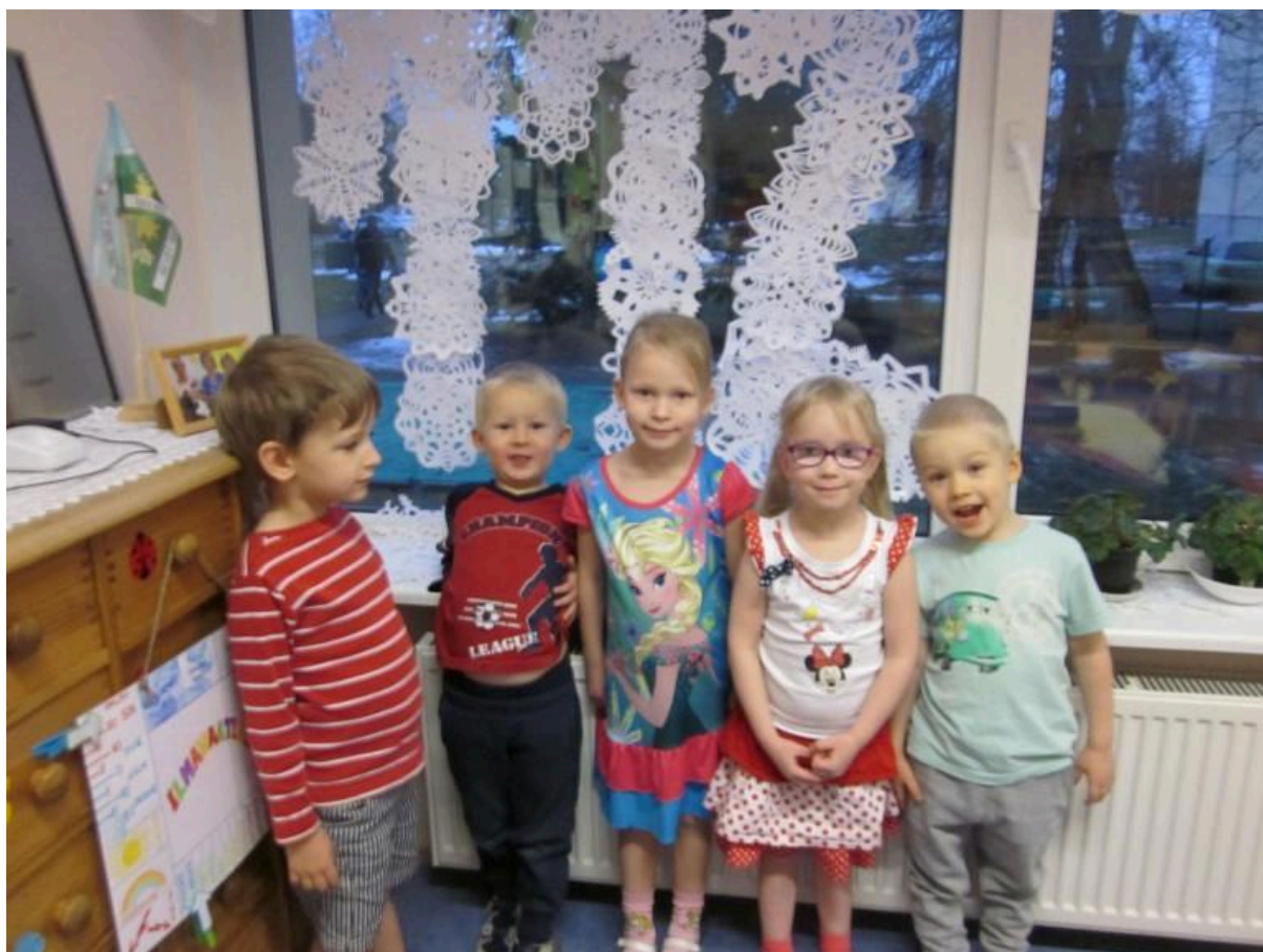
Mis kinni ei jää, saab mällu patsutataud- ütlevad väiksesed Tibutare Mikid