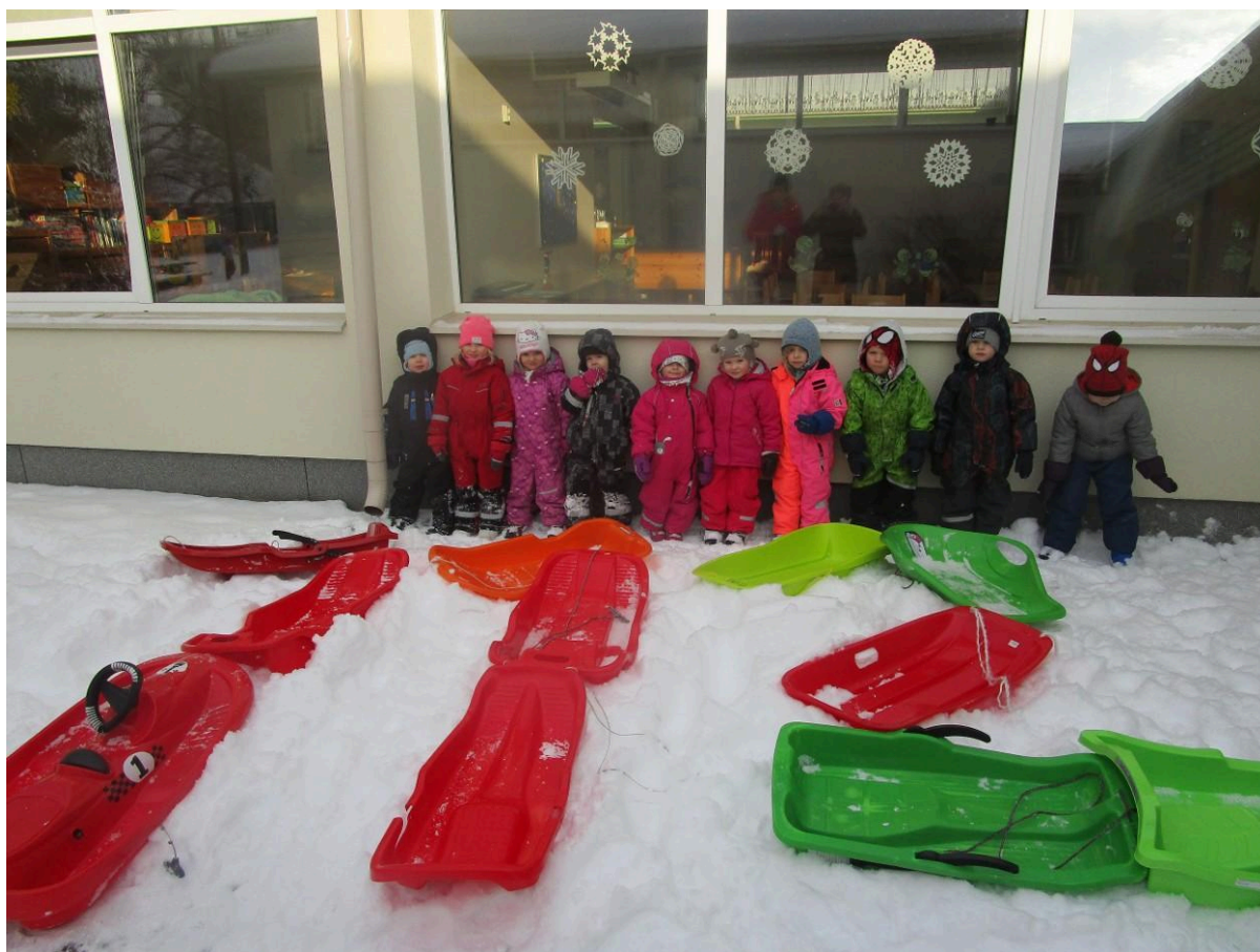
Sipsikud ja 112