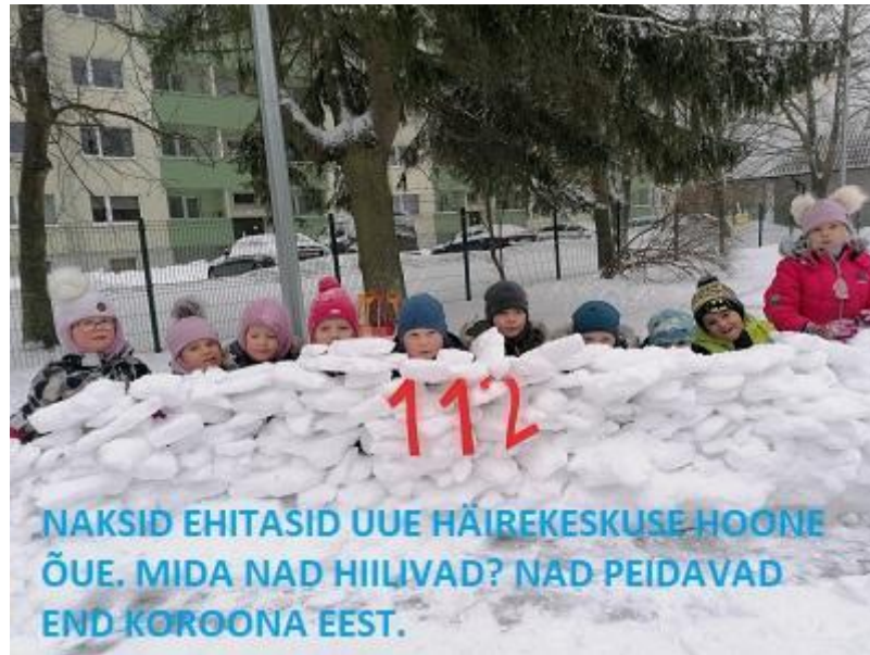
Naksid 4-5 aastased