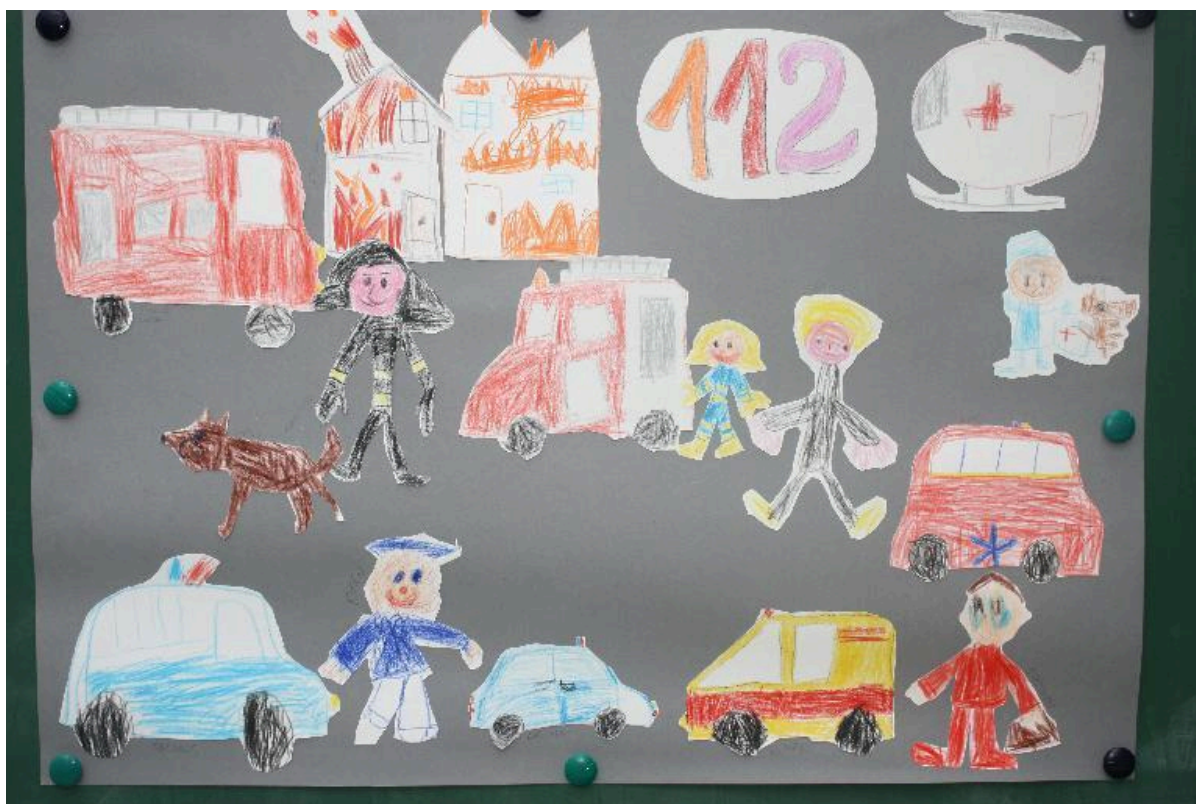
Tibutare Naksid teavad, mis on 112

Antud töö pälvis Päästeala infotelefoni 1524 auhinna : www.facebook.com/hairekeskus