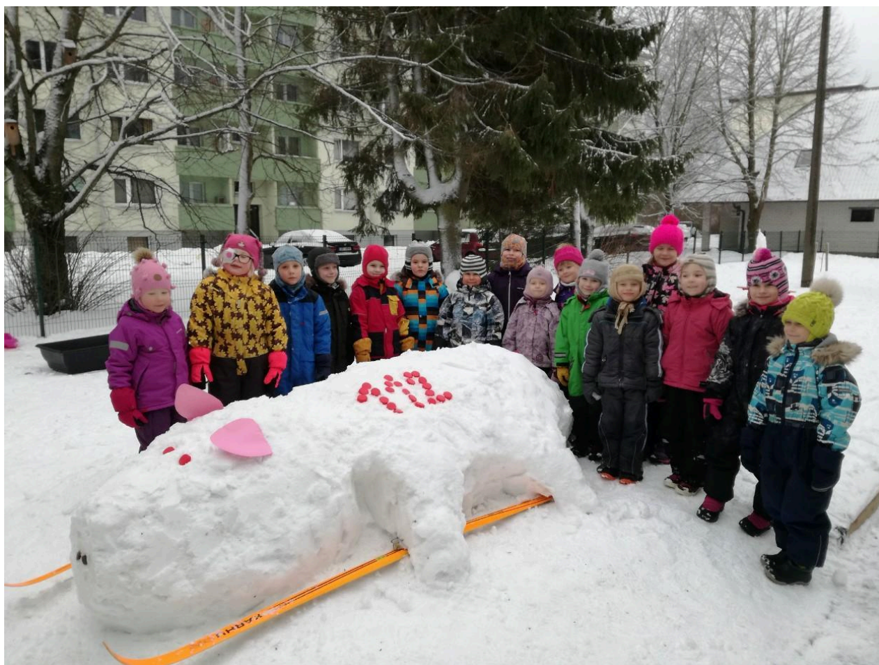
Naksid - Teemaks on suusatav siga, kes jõudis finišisse , kellel on stardinumber 112 ja pildi alateemaks "Spordi mõõdukalt!"