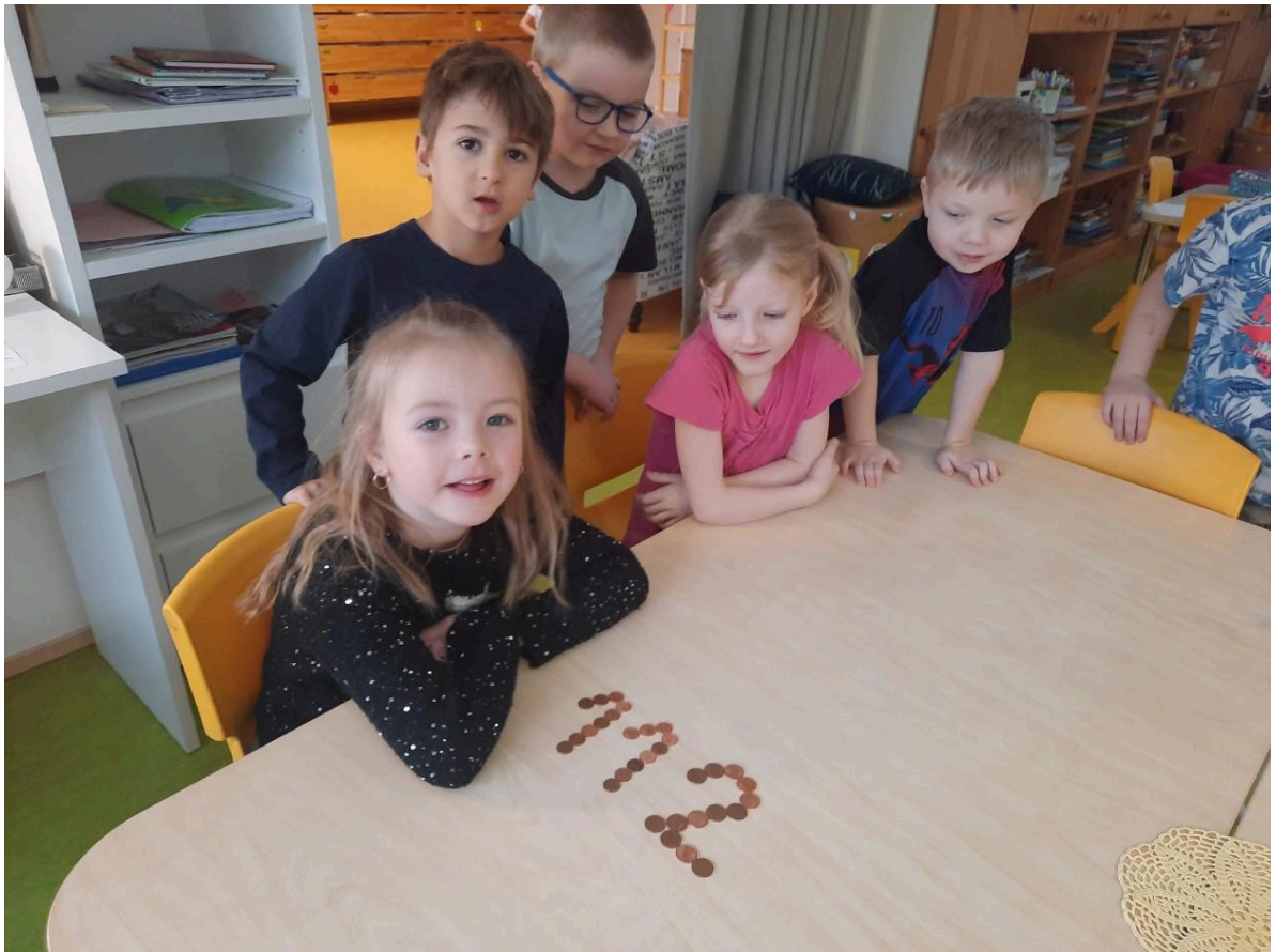
Krõllid (5-6 aastased)