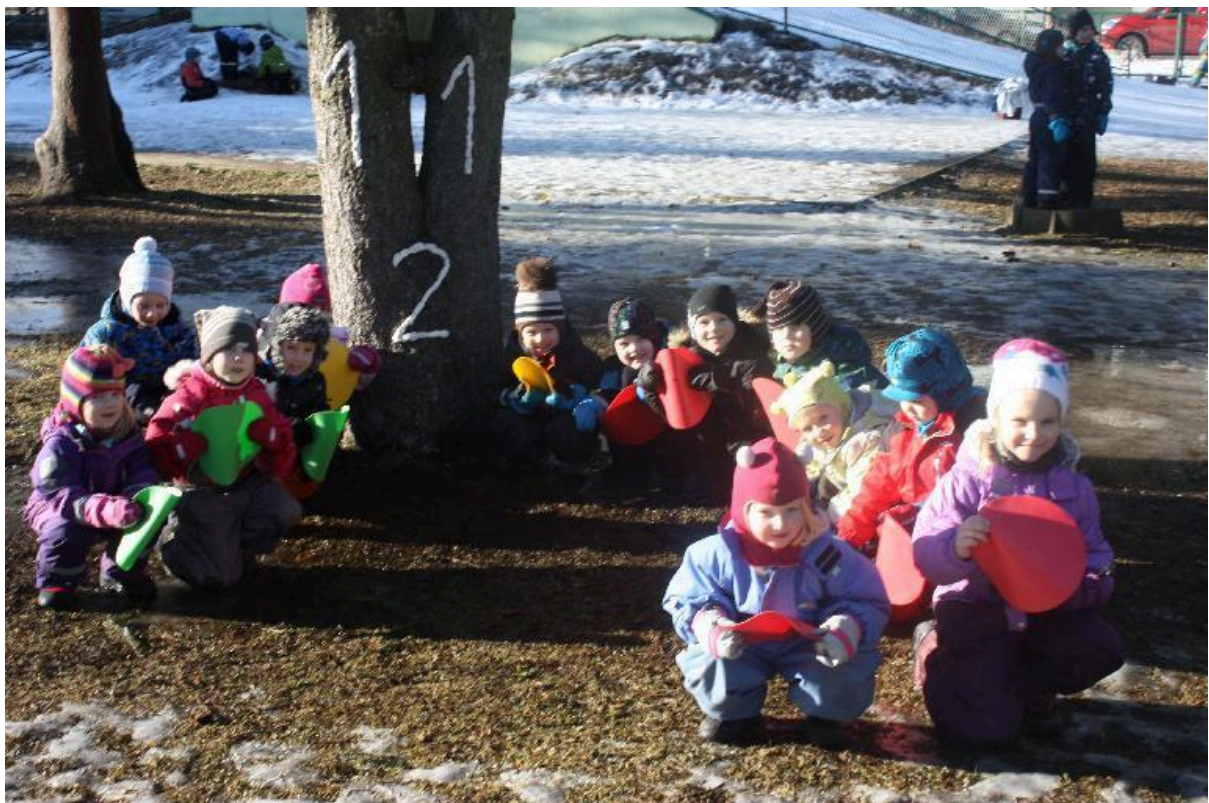
Tibutare Kiisud jätsid numברי meelde 3 valgusfoori tule järgi ja harjutasid rütmilist plaksutamist 112