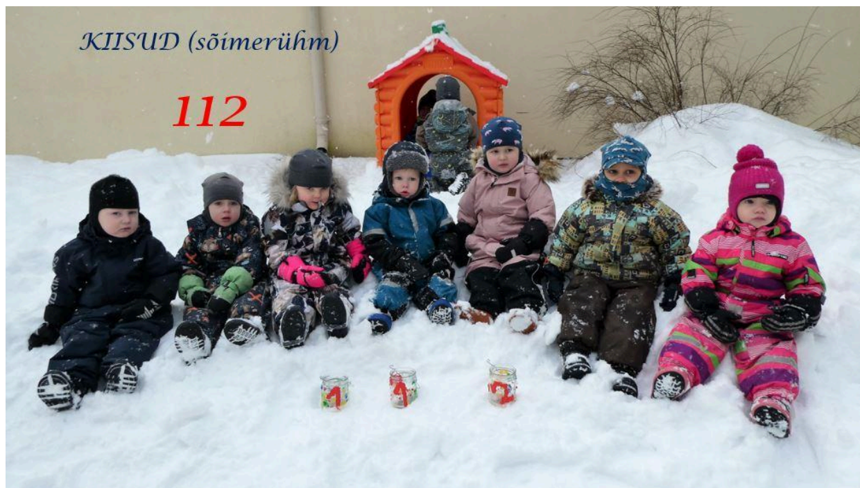
Kiisud 2-3 aastased