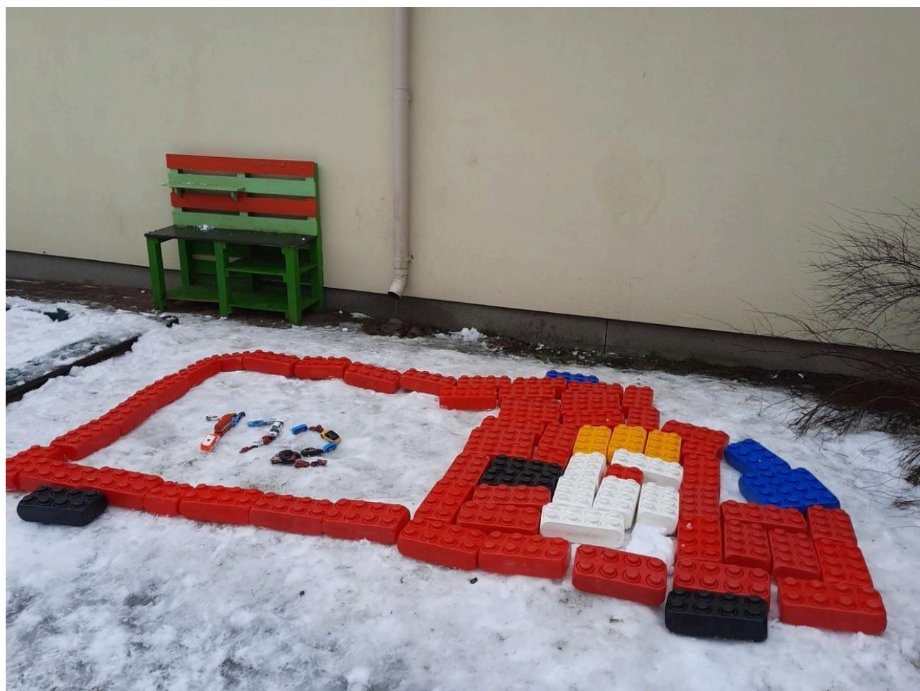
Sipsikud 6-7 aastased