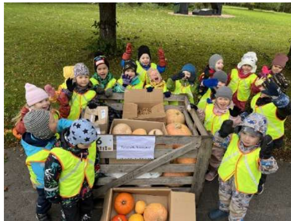
Sipsiku rühma õpetajad