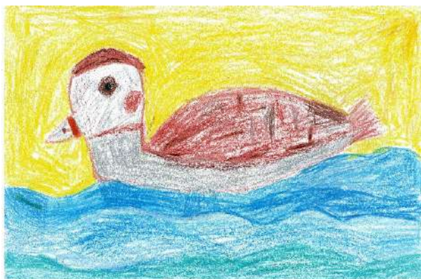
Grit Kööbi 6a.