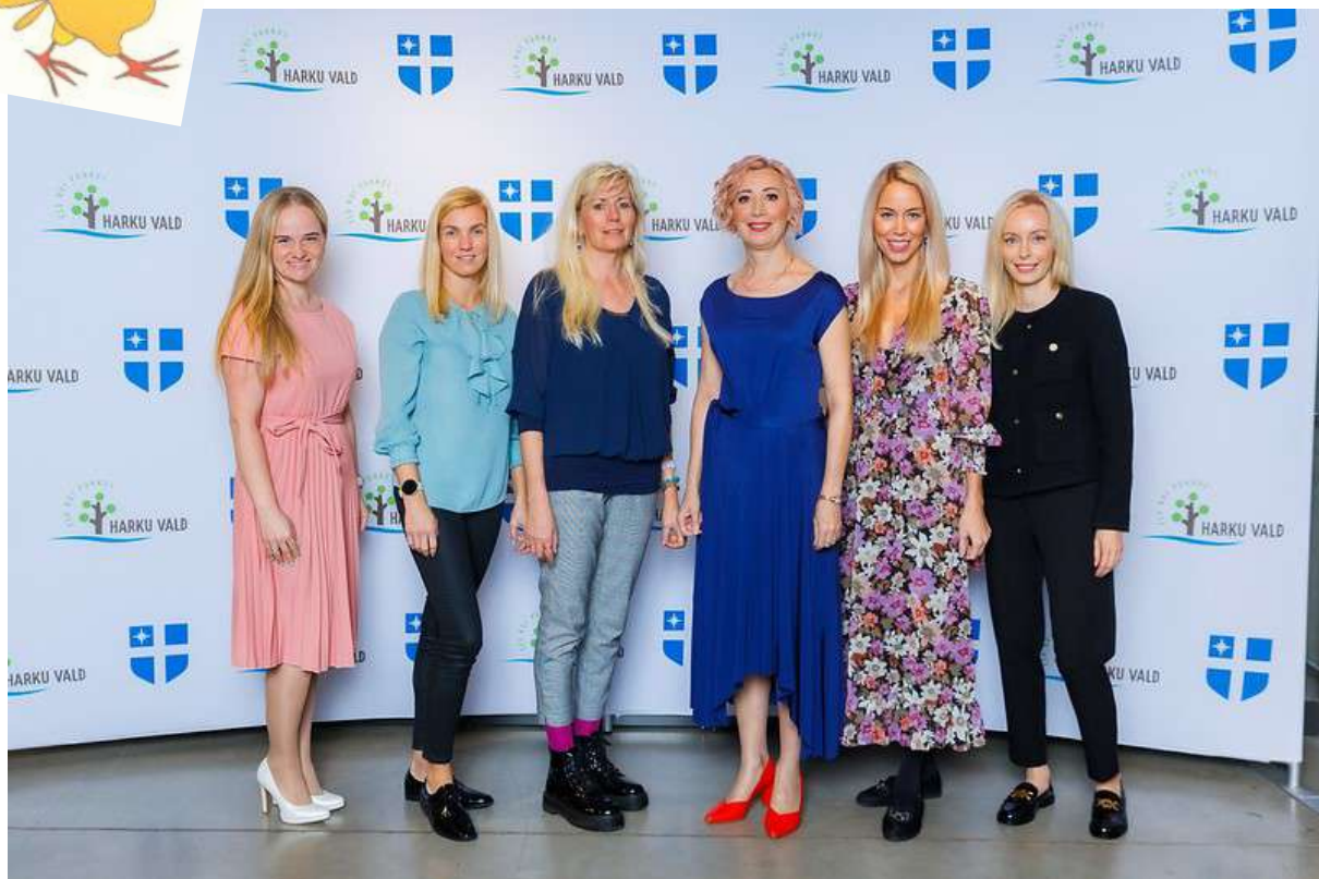
Tibutare pidupäevalised Proto avastustehases