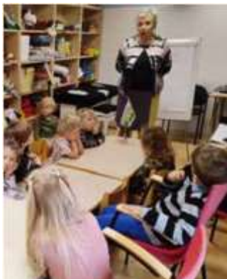
Koosolek Tibutare lasteaias.

See on tänapäevase hariduse kvaliteedimärk. Tegemist on koolide ja lasteaedade võrgustikuga, kus seostatakse õppimine päriseluga, tehakse koostööd lastevanemate ja praktikutega, kuulatakse ja julgustatakse lapsi ise tegutsema ning panustatakse