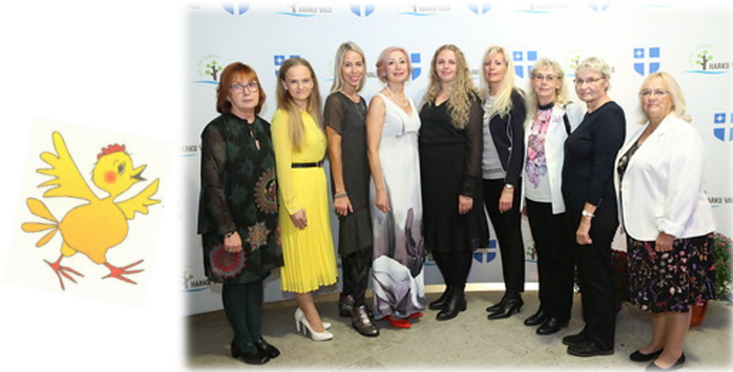
Tibutare pidupäevalised Vääna tall-töllakuuris.