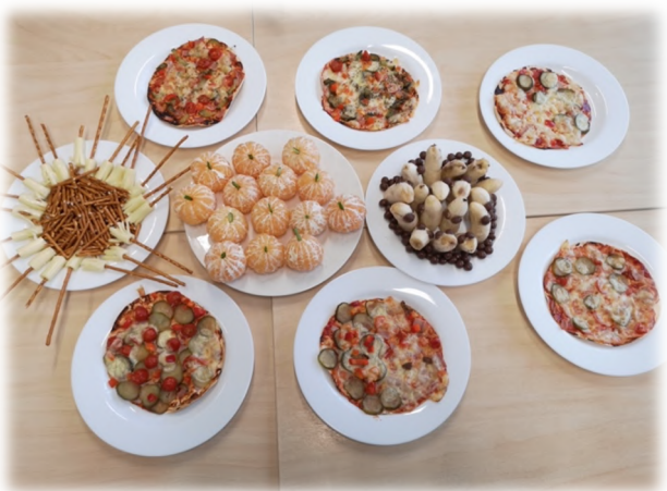
Kõik sai imehea! Ja ka silmale ilus vaadata.