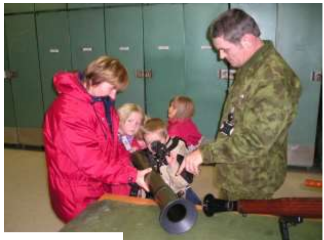
Kaitseväe külastus 2005 aastal