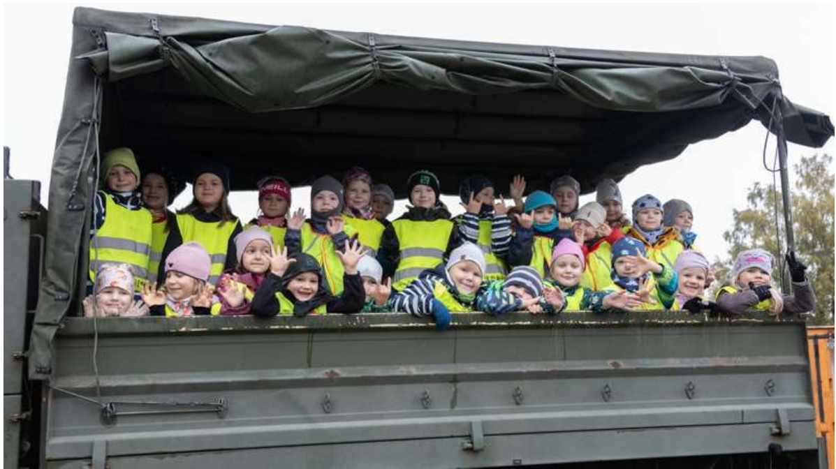
Pilte 2024 külastuses https://pildid.mil.ee/index.php?/category/62928