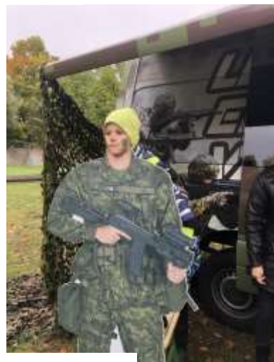
Kaitseväe külastus 2024 aastal