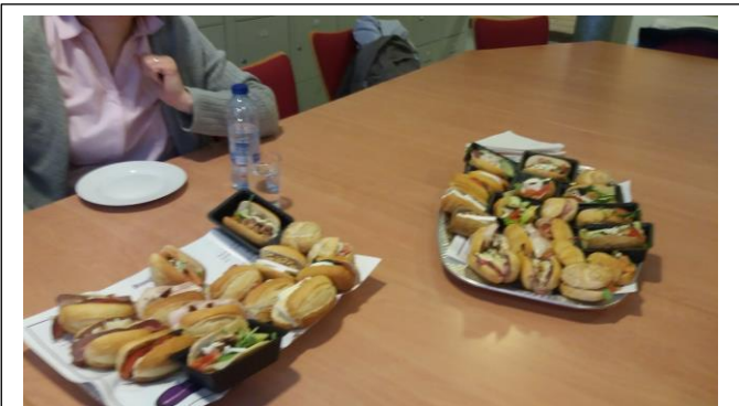
Koolilõuna võtavad lapsed ise kaasa karbiga. Muud kui võileibu seal lõunaks ei sööda.