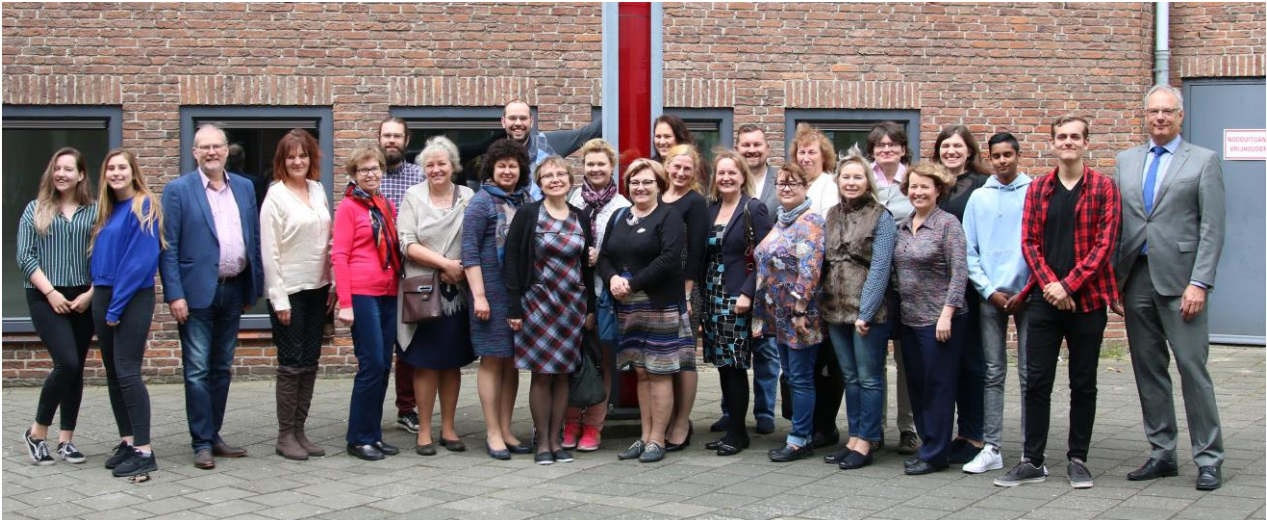
Meie õppegrupp koos Unesco Kooli esindajatega

Mulle väga sümpatiseeris see, kuidas lapsi õpetatakse maast madalast tekste analüüsima kindla süsteemi alusel. Kui õpetaja loeb lastele mingit jutukest, siis on väljas järgmised sümbolid: inimese pilt, maja pilt, välk ja vihmavari. Need sümbolid aitavad loost aru saada ja seda ka ise väljendada. Inimene- kes olid tegelased, maja- kus see lugu toimus, välk- mis seal toimus, mis juhtus ja vihmavari- kuidas lugu lahenduse leidis. Selline skeem aitab süsteemselt mõelda ja kindlasti toetab funktsionaalse lugemisoskuse arendamist, mis mõnel täiskasvanulgi veel raske (loeb, aga olulist infot ei taba).