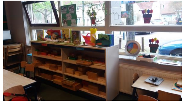
Arendavad mängud riulis on sorteeritud osaoskuse alusel, mida nad arendavad