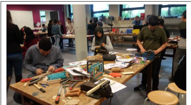
Tööõpetuse tunnis lapsed tegutsemas – kirjaliku juhendi alusel grupis rolle jagades