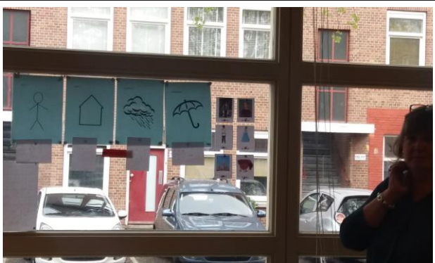
Teksti mõistmiseks ja analüüsimiseks sümbolid