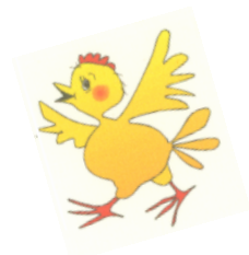
Ootusärevus Sakala kultuurikeskuses - kohe algab etendus „Nukitsamees“