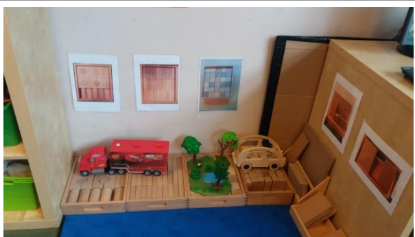
Ehituskeskus-ülesanne, mis lahendada seinal