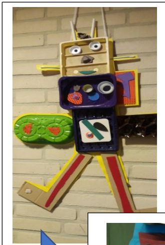
Ka Hollandis taaskasutusmaterjali dest meisterdamine väga populaarne