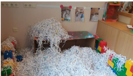
Oh seda rõõmu- paberipurustusmasinast lumi