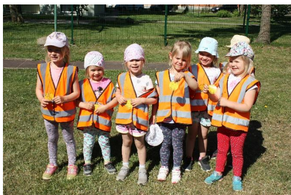
Kiisude tüdrukud medalitega